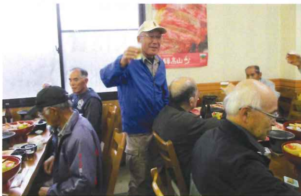
部長のカンパニー