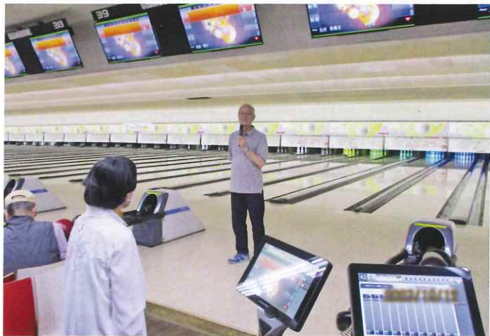
互助会長あいさつ