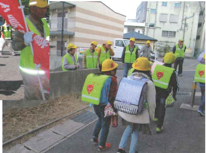
「子ども安全見守り隊」