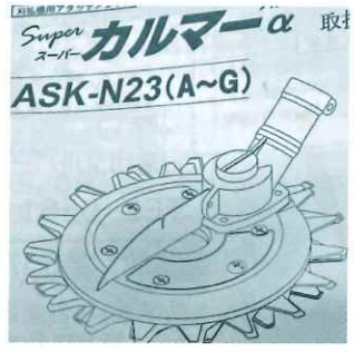
Super Asakuma ASK-N23(A~G) 取付

受講者は男女6名でしたが、使用する草刈り機をメインに説明があり、作業の際の服装や装着する機器及び草刈り機本体の構造など丁寧な内容で素人の私にも分かり易いものでした。