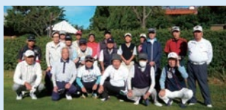
10/21 品野台カントリークラブにて