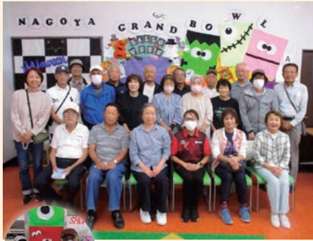
〈参加者〉 男性 14名・女性 9名・計 23名