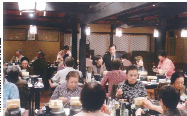
川場悠湯里庵研修旅行