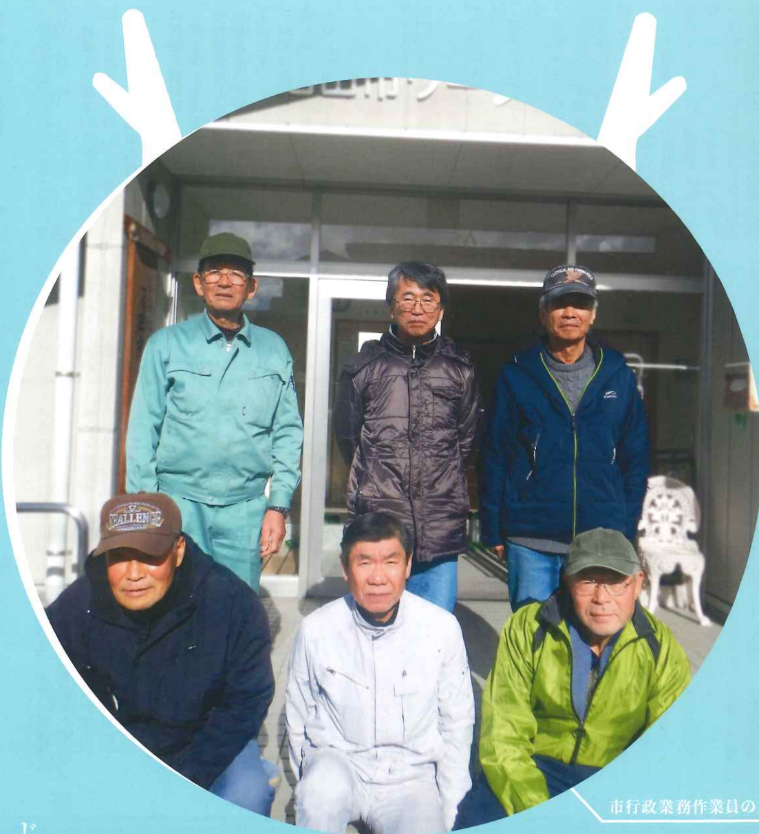
市行政業務作業員の方々