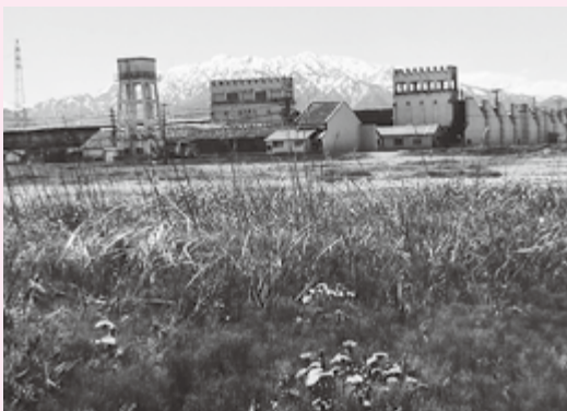
◀巨大なガスタンク、高い煙突はすでになく、洋風の形した排気塔、幾重にも連なるノコギリ屋根。「女子寄宿舎」跡地に咲くタンポポ...

縁あって私も二十年余も勤務し、苦しい家庭を支えていただいた。思えば「諸行無常」の感、悟り難し。