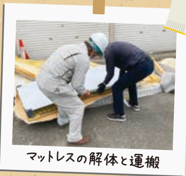
マットレスの解体と運搬