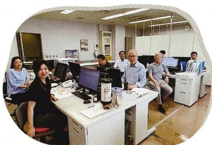
小田原市シルバー人材センターのスタッフ