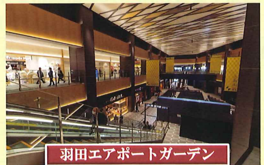
羽田エアポートガーデン

羽田空港第3ターミナルに直結した新しい商業施設「羽田エアポートガーデン」が2023年1月31日にグランドオープンしました。約70の店舗が並び、日本の伝統工芸品や日本ならではの雑貨、各地のご当地グルメ・お土産などがずらり。