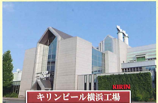
キリンビール横浜工場

「海の玄関」のイメージから「マリン」と「エントランス」の単語を用いた造語とのことです。地上51メートルの10階展望室は外壁側が一面ガラス張りとなっているため、贅沢な360度パノラマビューです。