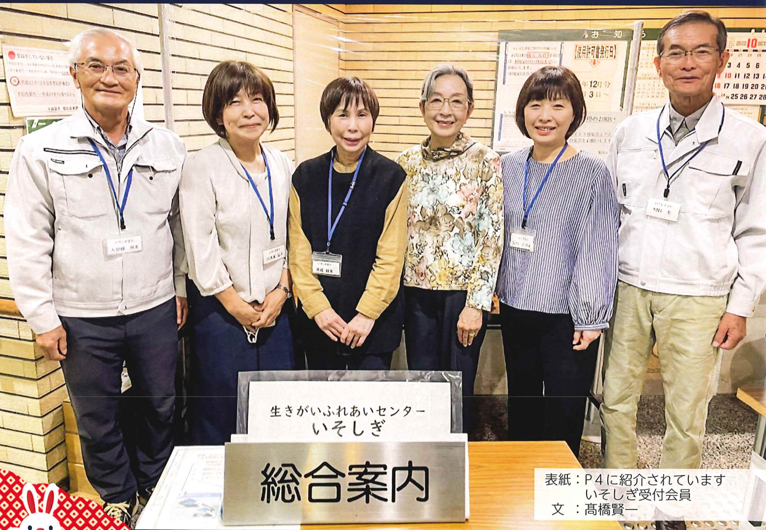
表紙：P4に紹介されています いそしぎ受付会員 文：高橋賢一

✂ 「AKASHI」と共に ホップ、ステップ、ジャンプと人生の「飛躍」をしていきましょう。✂