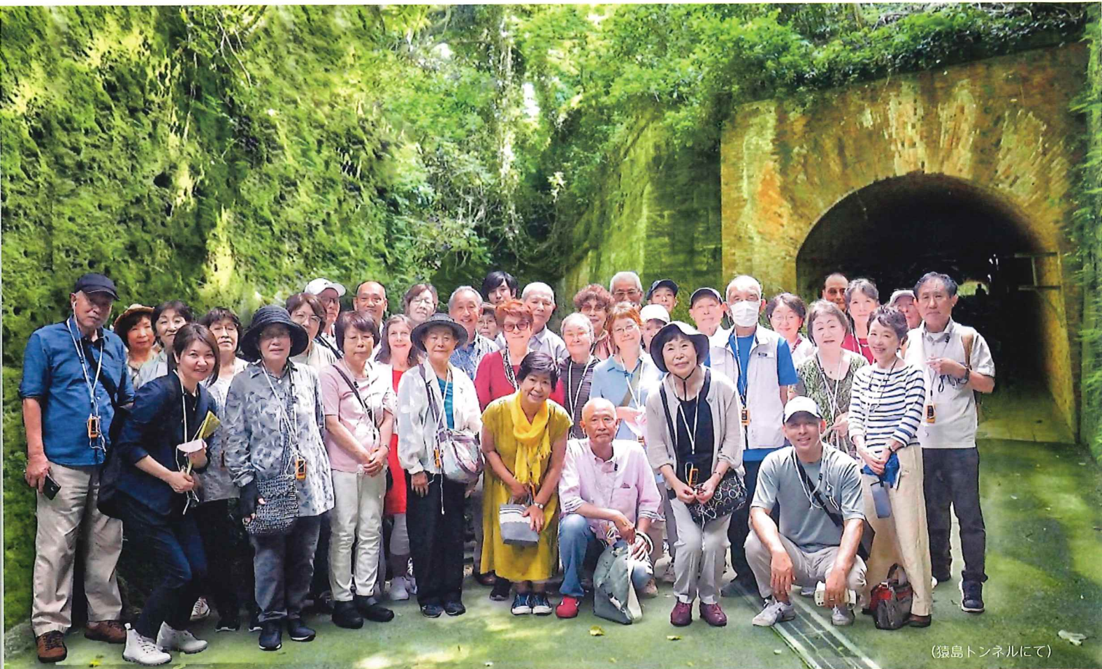
(猿島トンネルにて)

〒256-0816 小田原市酒匂2丁目32番15号 電話:0465-49-2333 FAX:0465-49-2336