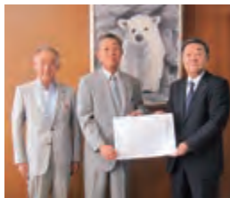
小松市議会議長と船木市議会副議長へ