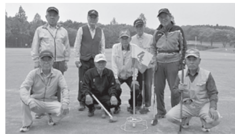
5月21日 定例会に参加の会員