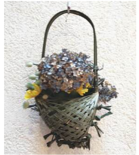
手工芸：籠（シュロの木）