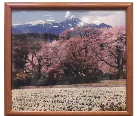
写真：南アルプスと桜