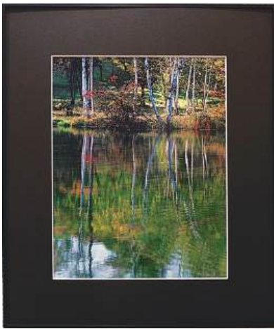
写真：朝光をあびる

【絵画】栗原敏雄 【写真】森脇鏡子 小野塚一 高柳賢一 江黒房男 河原秀雄 大戸利子 岸野敏彦 中西貞夫 笠原修一 木川雅文 関根朝子 【手工芸】内田のり子 峯保男 下山由記子 山口孝二 小笠原守男 木川雅文 【陶芸】内村一郎 鷹尾民江 島田駿 【盆栽】荒井俊雄