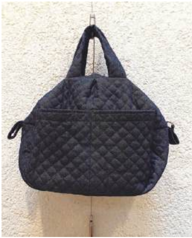
手工芸：やさしい木綿のバッグ