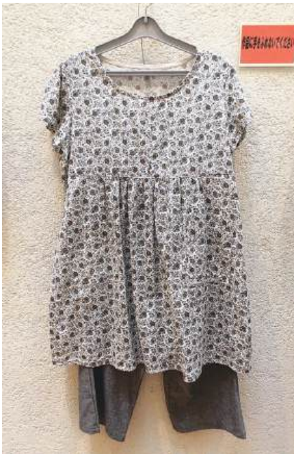
手工芸：楽で着やすい普段着