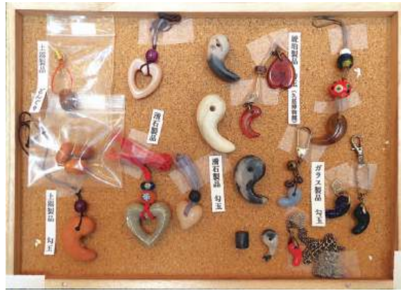
手工芸：いろいろな勾玉と土器