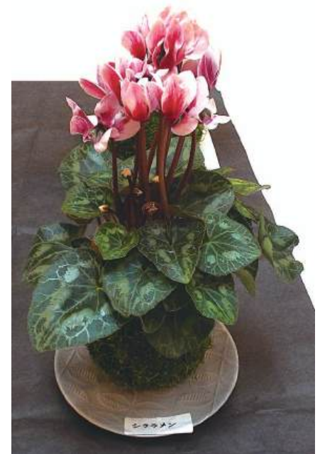
盆栽：苔玉 シクラメン