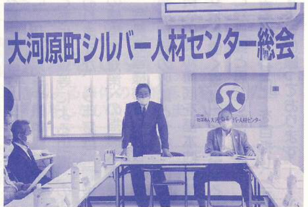
大河原町シルバー人材センター総会