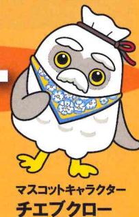
マスコットキャラクター チエブクロー