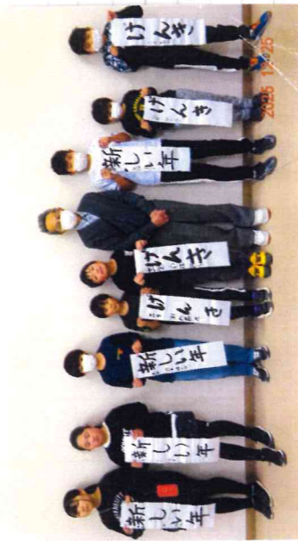
皆さんが入りました。

新年おめでとう ございます。 今年4月から厚生労働省の定める「新たな契約方法」へと移行する重要な年になります。フリーランス新法へ対応するために請負・委任の仕事が対象となりますので、一部の会員様が該当します。センターから書面でお渡