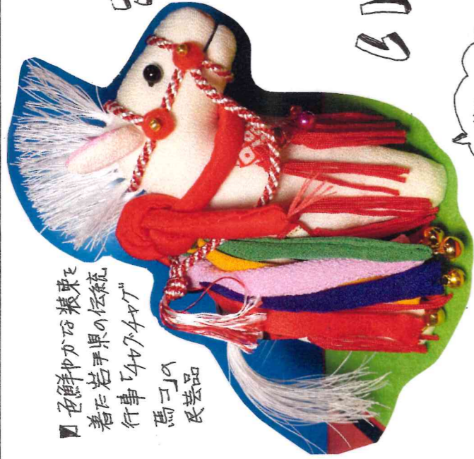
色鮮やかな装束を 着た若手県民の伝統 行事「4474ヤグ」 馬子の 氏芸品