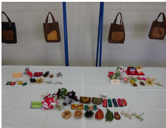
◆手芸やろまい会の作品展示