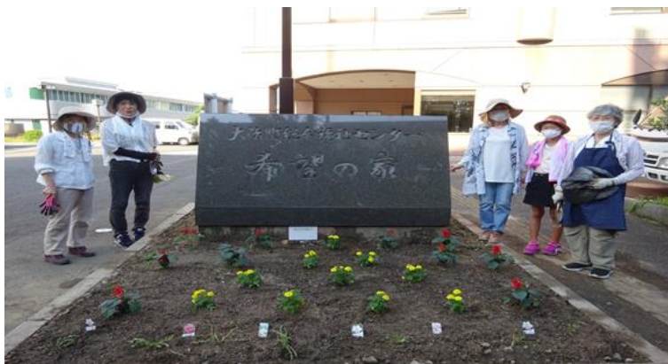
完成 お孫さんの協力も