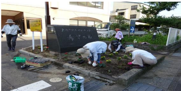
除草して花を植えます。

★ボランティア活動・退会抑制の一環としてガーデニング活動「花クラブやろまい会」を発足!花壇に花を植えて気持ちに潤いを。 ★花壇の場所は、希望の家西側『希望の家』石碑前花壇です。3・4種類の花が見ごろです。