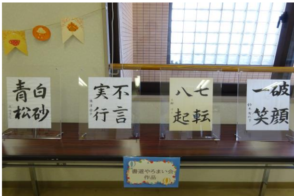
◆書道やろまい会の作品展示