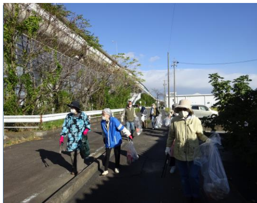
◆ゴミ拾いの現場スナップ

センターの役割である高齢者の生きがいと社会参加の促進について地域の方にPRすることを目的に今回で7回目となる希望の家周辺の「清掃・ゴミ拾い」のボランティア活動が行われた。また当日は会員交流事業も連動し、2F会議室で第1回目の会員作品展示及び会員の活動状況も写真で紹介された。