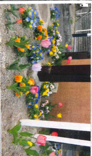
花アレンジメントの制作風景

会に大変喜ばれます。 た制作が中心のため名 をまい会は草を使っ 開催している手芸や ▼現在 毎週火曜日に し就業希望の高齢者向 けのPRを行います。 島ハローワークに設置 ▼仕事募集一覽表を津 島ハローワークに設置 ました。