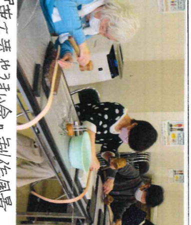
『花アレンジメント会』制作風景

会に大変喜ばれます。 た制作が中心のため名 をまい会は草を使っ 開催している手芸や ▼現在 毎週火曜日に し就業希望の高齢者向 けのPRを行います。 島ハローワークに設置 ▼仕事募集一覽表を津 島ハローワークに設置 ました。