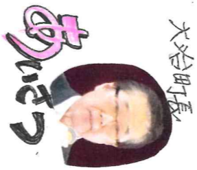
大治町長 大治町長 あいさつ

今年で37回目の総会と聞きました。おめでとクジがいます。貴センタも高齢化が進み、苦勞も多いと聞き、大治町も21世代の皆様が活躍されています。大治町も21世代の皆様が活躍されています。大治町も21世代の皆様が活躍されています。