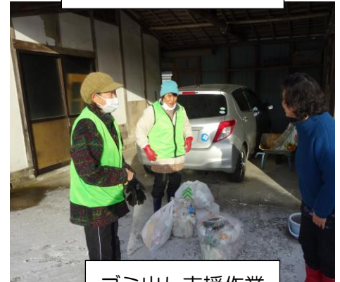
ゴミ出し支援作業

※ ホームページや会報等に作業の様子の写真を使用することがあります。写真の使用を希望されない方は事務局までご連絡をお願いいたします。