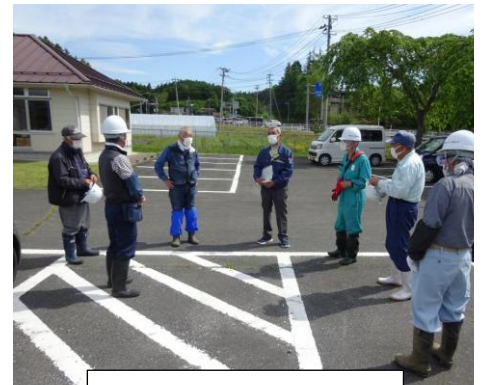
作業前の打ち合わせ