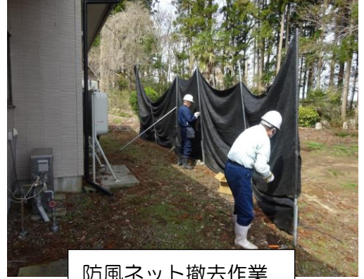
防風ネット撤去作業