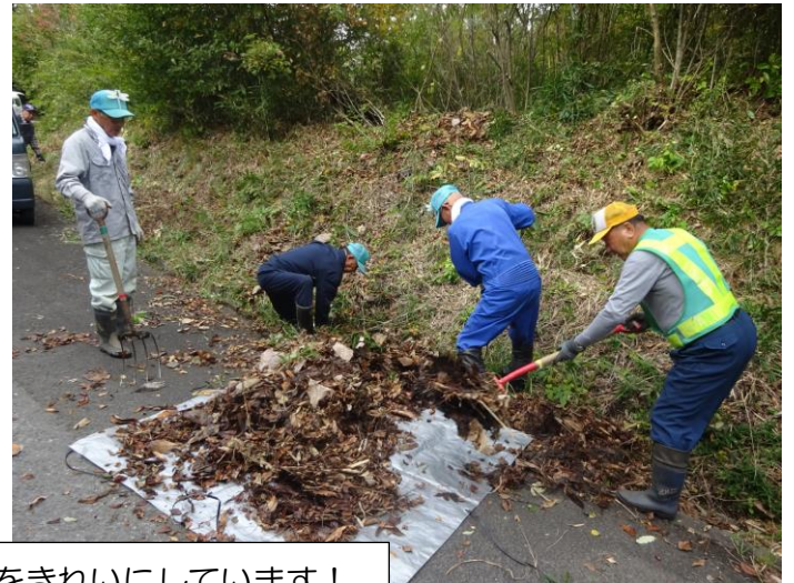
除草作業後の現場をきれいにしています！