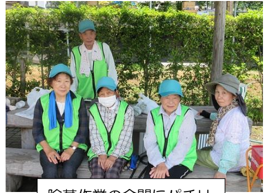
除草作業の合間にパチリ