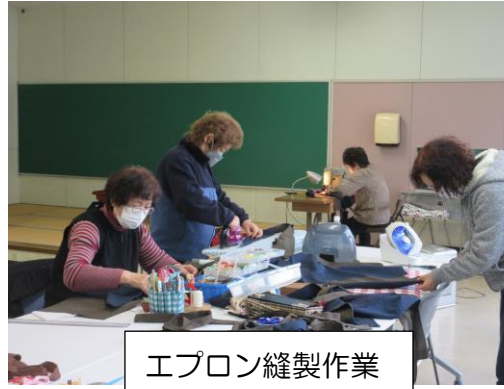
エプロン縫製作業