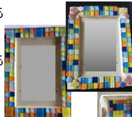
写真立て、小物入れ