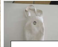
ひら麻呂ワンポイント トートバッグ