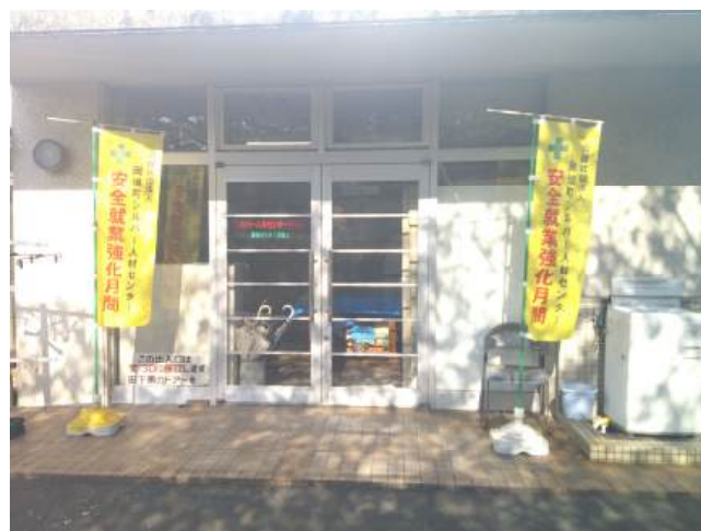
☆作業室入口ののぼり旗