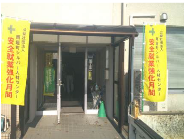
☆事務所入口ののぼり旗