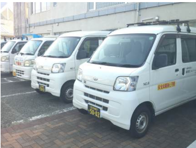
☆社用車ステッカー掲示①