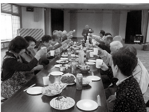
参加者は年々減る傾向でも、皆元気で。