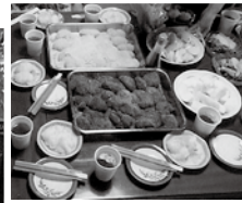
▲ひと白目のもちだんごが完成。