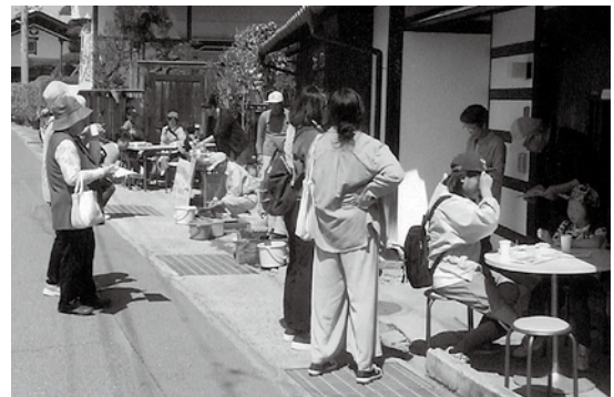
▲人が切れ目なく賑わいました。

すごく天気が良く真夏のような様子でした。刃物研ぎ、会員の作品販売、手造りの漬け物と冷たいお茶のサービス、スタンプラリーを求めてお客さんは切れ目がない！