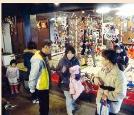
▲親子連れで賑わう邸内

○ひな街道まつり(シ16〜シ31) 甘酒を振舞いました。会員手作り作品の販売には多くの子供達も訪れました。