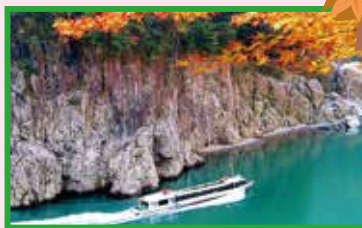
▲恵那峡クルージング