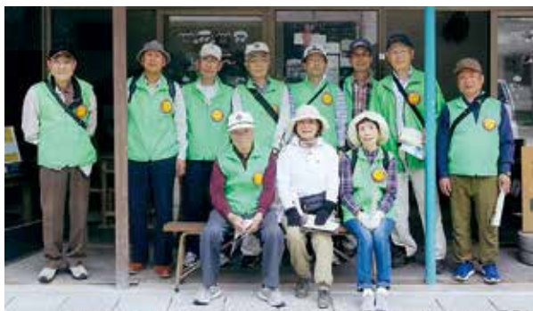
御田町のミーミーセンタースメバ玄関にて