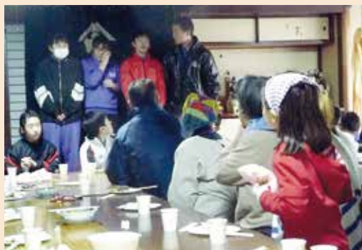
▲餅を前に卒業生から感謝の言葉