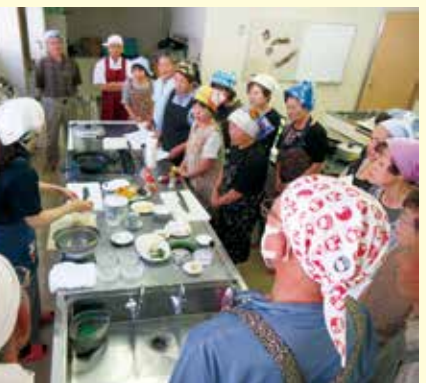
▲昨年の料理教室 男性会員も参加しました!