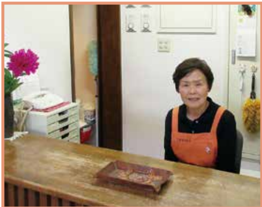
「旦過の湯」のフロントにて

定年後の一年毎の契約更新で働ける喜びを実感し、人とのふれあいを大切に、これからも頑張っていきたいと思っています。