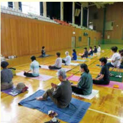
▲昨年のヨガ教室の様子