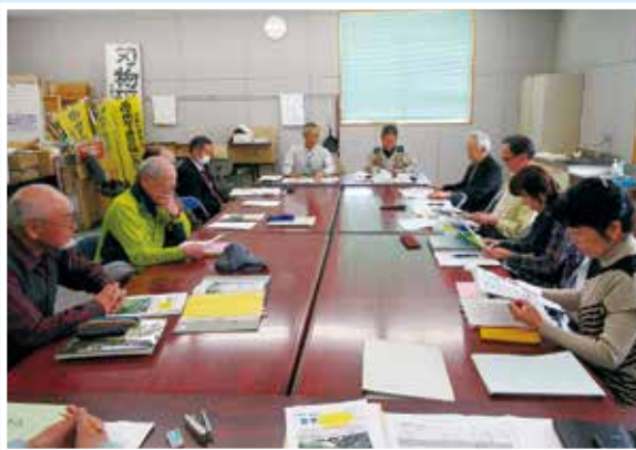
「みずうみ」編集会議の様子

その結果、今回の第125号から、できるだけ文字を大きくし、全ページカラーとして、読む会報から見る会報に転換していくことにしました。また、カラー化による経費増を防ぐため、ページ数を8ページにしました。皆さんの感想をお待ちしています。