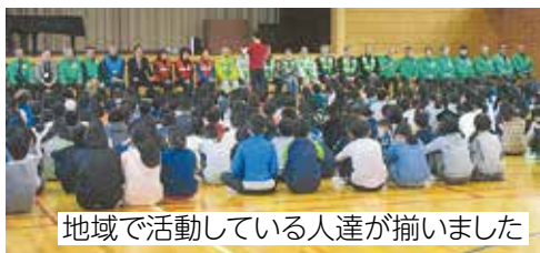
地域で活動している人達が揃いました