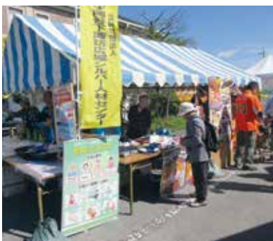
岡谷市のイルフ平面駐車場で開催！

10月5日、友禅、わら細工、手芸各同好会の協力を得て参加しました。チラシとティッシュを配布し、PRに努めました。