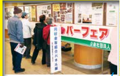
同好会等パネル展