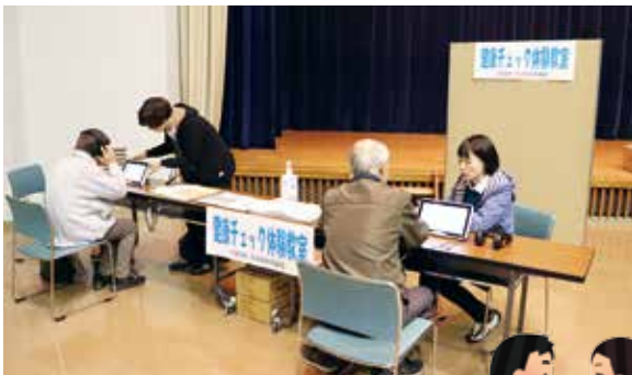
下諏訪町社会福祉協議会協賛による「健康チェック体験教室」