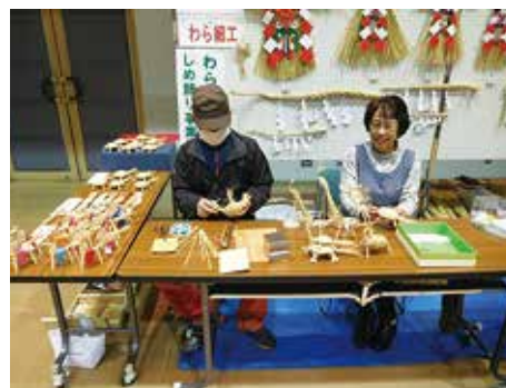
▲令和1年、シルバーフェアでの実演と販売