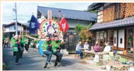
▲伏見屋邸前の長持ち

今回から 30 ポイントあったスタンプラリーが 5 ポイントだけのクイズラリーになり、例年開店前から賑わう社中学の売店も閑散とした状態でした。外回りは例年どおり刃物研ぎやお騎馬の所作、長持の振込み等で賑わっていました。