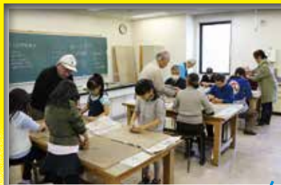
やきもの体験教室