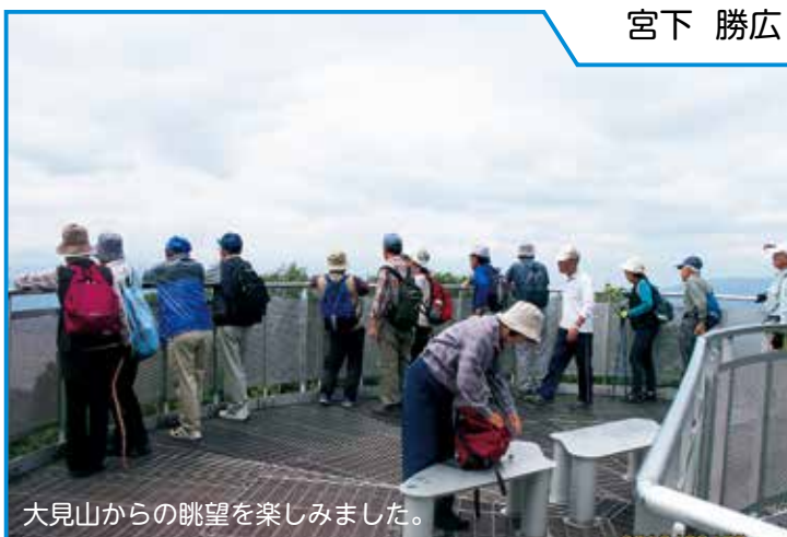
大見山からの眺望を楽しみました。

9月28日、会員親睦ウォーキング(諏訪百名山大見山を登ろう)を初めて実施しました。