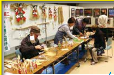
しめ飾り等予約販売