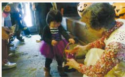
▲お菓子をもらう子ども

友の会会員二人が作った「かぼちゃ」2 個を出展、格好の良い方をクイズ対象にしました。