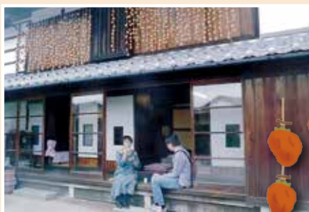
▶柿簾の下でひと休みする観光客

柿簾を見つけて新聞記者が取材で入ってきて、作業を珍しそうに見入っていました。柿は約 1,500 個でした。