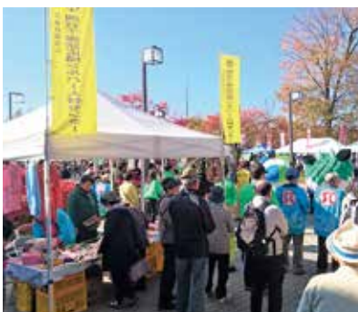
多くの参加者で賑わいました！

11月9日、下諏訪総合文化センター広場で、PRも兼ねて、手芸、友禅染、やきもの等の販売を行いました。