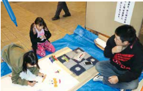
「お絵描き」を「落書き」にして実施しました。