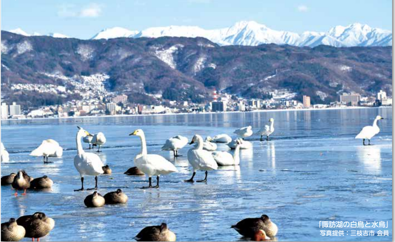
「諏訪湖の白鳥と水鳥」