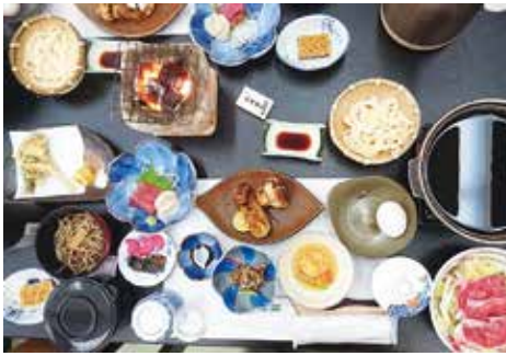
〈昼食〉 飛騨牛・松茸のすき焼き鍋 と松茸づくし

その後、恵那峡フルーzing、岩村城下町を散策して日程を終えました。会員の皆さん、来年も仲間を誘い多くの人に楽しんでほしいと思います。