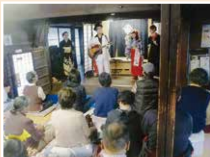
▲オープニングでのご挨拶