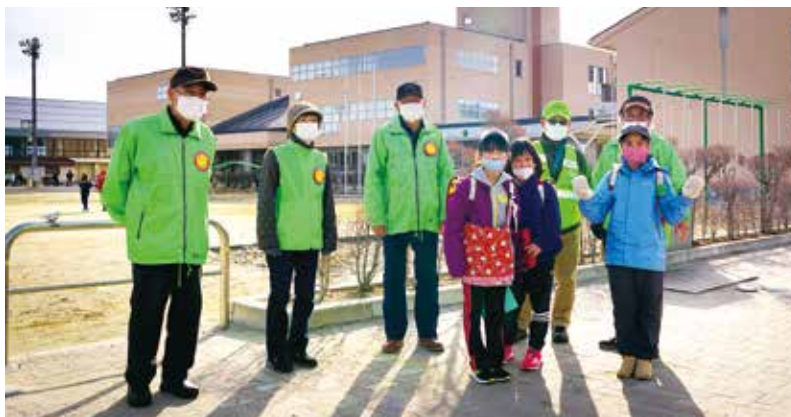
下校時の見守り隊 (下諏訪南小学校にて) 子ども達と一緒に。

今年度から、子ども達が下校時に自ら主体的に行動できるように、誘導や注意喚起は極力しないことになった見守り隊。毎月統一行動日を設けて、南小・北小の下校時に統一のブルゾンを着用して見守りに当たっています。