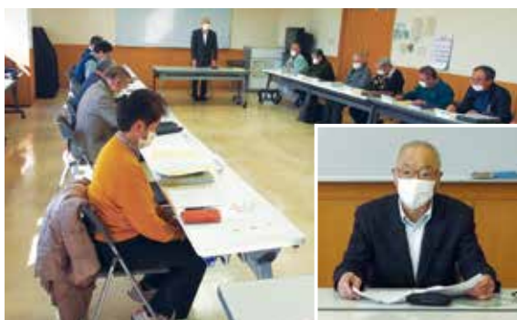
▲理事研修会の様子