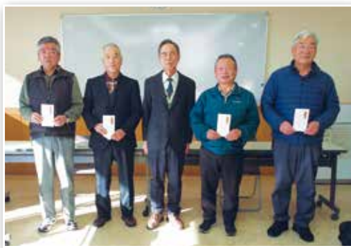
▲入選された皆さん