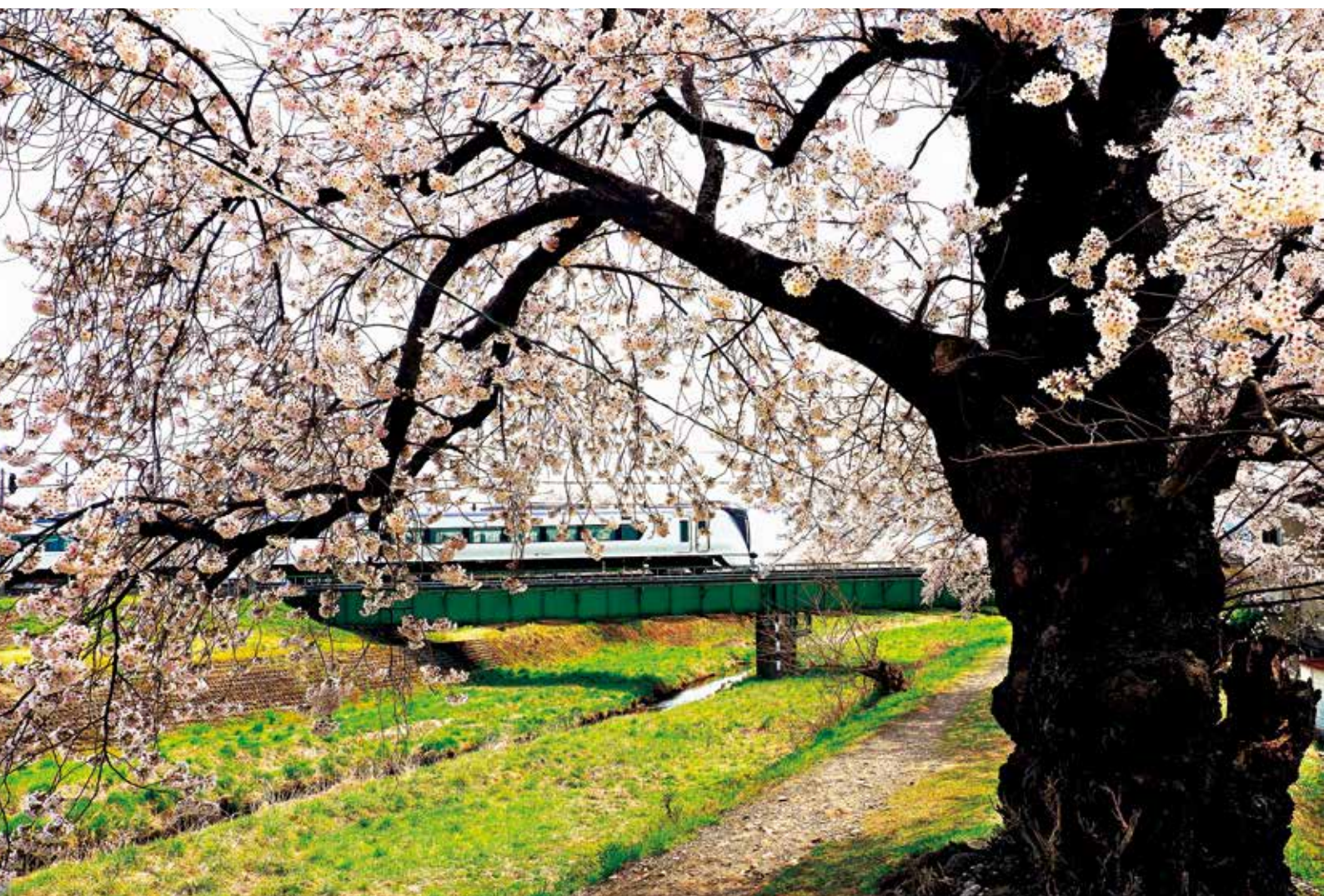
横河川桜と特急