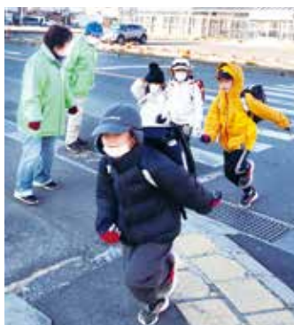
▲砥川西交差点にて

シルバー ボランティアだより シルバーの会員が、ブルゾンを着て毎朝学童の登校の見守り活動を行っています。