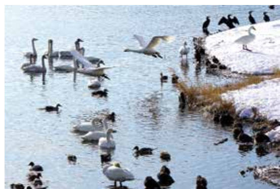
▲北帰行を待つ白鳥

エネルギー：116kcal/ たんぱく質：2.7g/脂質：2.4g/食塩：0.1g