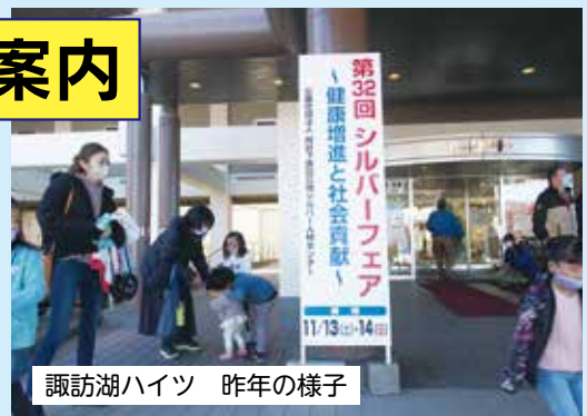
諏訪湖ハイツ 昨年の様子

☆シルバーフェアを10月29日(土)・30日(日)に 下諏訪総合文化センターで開催します。 —今から作品の出展準備をお願いします—