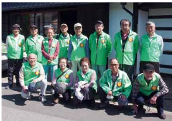
参加したあるこうかいの皆さん