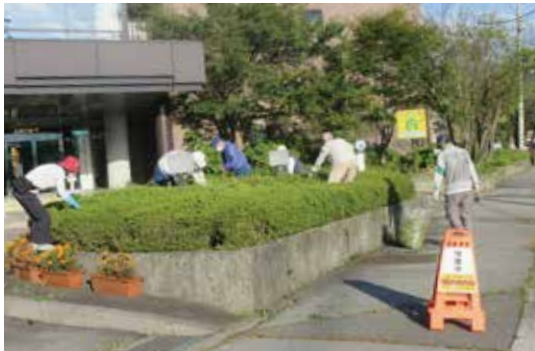
下諏訪総合文化センター 昨年の様子