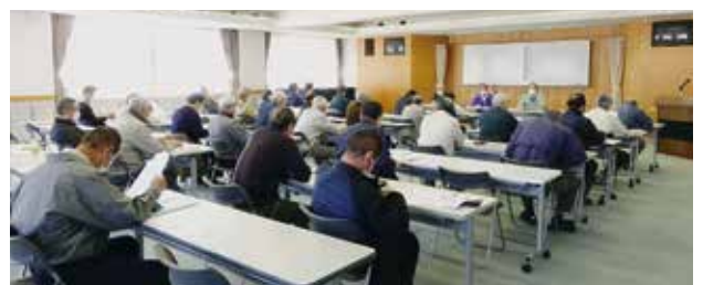
業務内容の説明を受ける地域班長の皆さん

4月5日、令和4年度の地域班長(地域安全対策委員)への業務説明会を開催しました。