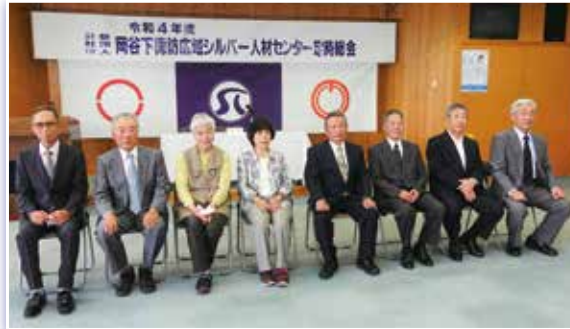
退任された役員の皆さん 長い間ありがとうございました (両端は正副理事長)