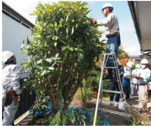
▲草刈り班、植木班の作業現場を視察する安全委員