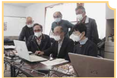
パソコン同好会の皆さん