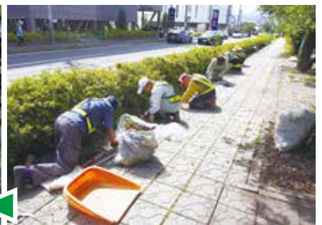
道路の草取りをする除草班(岡谷)の皆さん