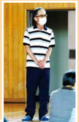
あいさつをする理事長▶

冒頭、五味さは子部長は、「昔は料理をテーマにしてきたが、最近は体を動かす内容が多い。リフレッシュする機会だけではなく、普段会わない人と交流する機会になっていたので、出来るだけ多くの会員に参加していただきたい」と話をしていました。