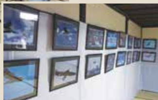
オオワシグルの写真▶