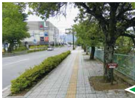
作業後きれいになりました

岡谷地区の草取り班は、岡谷市役所南側の中道町線の植樹帯や街路樹のツリーサークルの草取りを実施しました。毎年恒例で会員7名が7月11日～7月20日の期間に膝をついて、丁寧な手作業により整備しました。 この期間は雨が多く、蒸し暑い中、大変な作業でした。