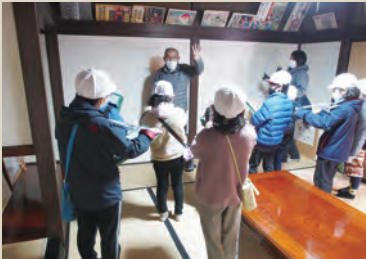
▲案内をする「友の会」の会員と説明を聞く北小児童

して栄えた歴史や、建物に施された知恵を生かした工夫などを聞き、懸命にメモを取っていました。