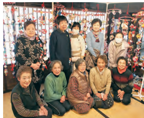
▲手芸同好会・事業部会 下諏訪の皆さん