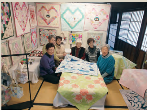
▲会場で作品を披露するホヌの会会員

○パッチワーク・ハワイアンキルト作品展(1/11~1/26) 下諏訪町の老人福祉センターを拠点に活動する手芸グループ「ホヌの会」によるパッチワークとハワイアンキルトなどの作品展「春を待つ」が開催されました。 作品展は平成30年に開いて以来2回目。色とりどりの台布に、ハイビスカスなどの花や自然の形をイメージした布を縫い合わせて作るハワイアン