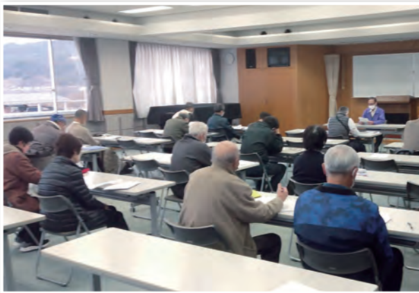
3年目研修会の様子