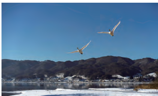
▲コハクチョウ、北帰行を前に

【1人分の栄養価】 エネルギー：96kcal / たんぱく質：3.5g / 脂質：3.1g / 食塩：1.2g