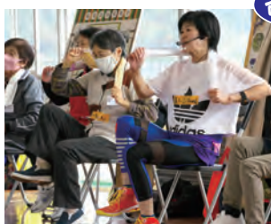
▲ いきいき健康体操