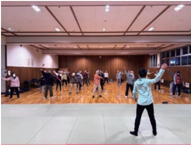
健康講座（腰痛予防）