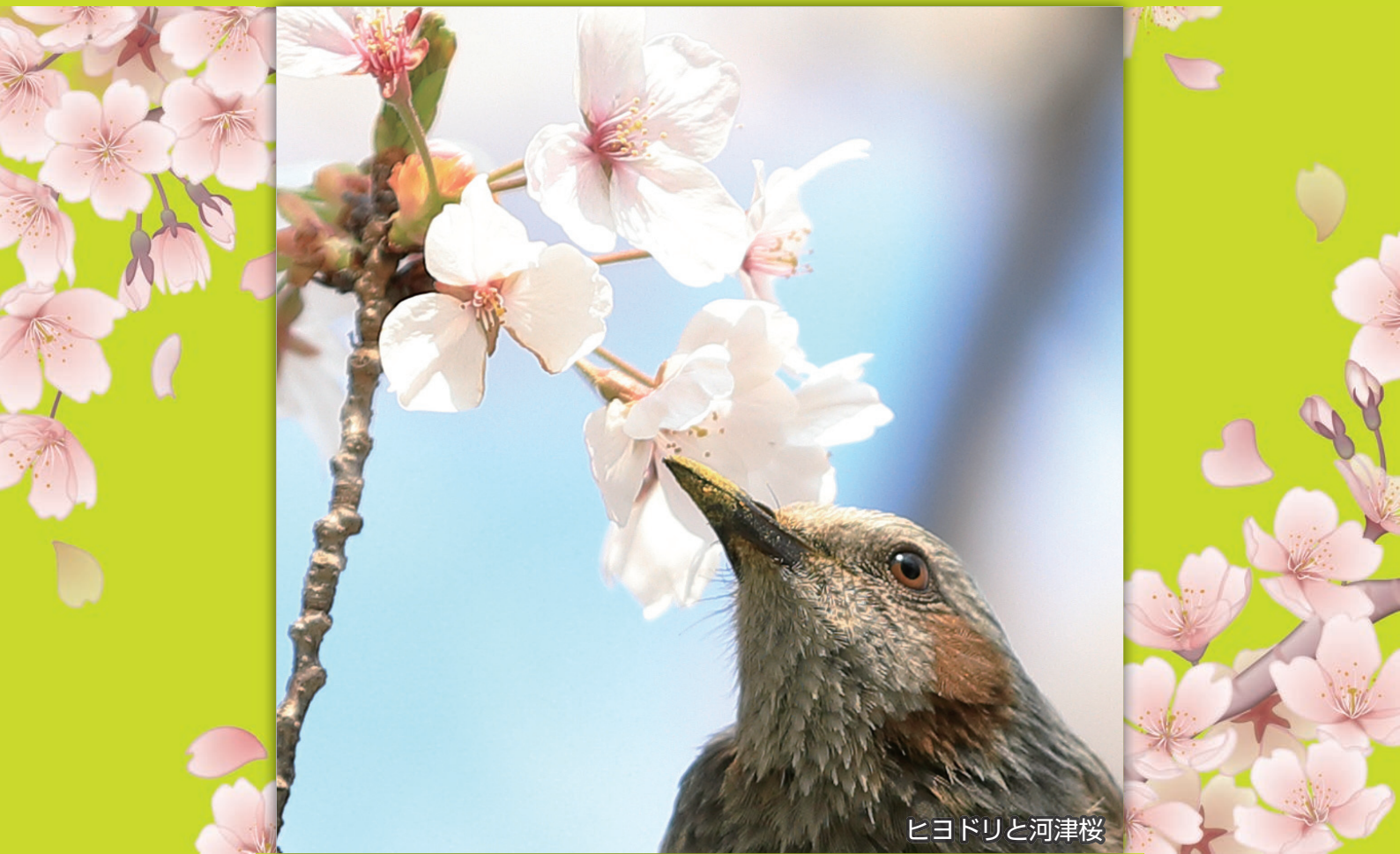
ヒヨドリと河津桜