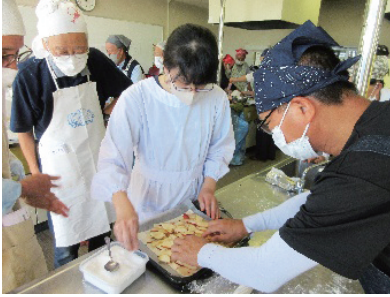
おとこの料理教室