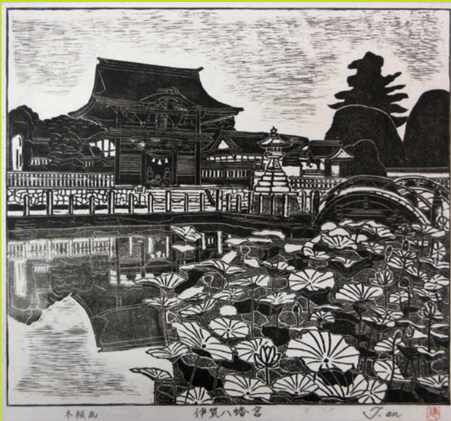
木版画「伊賀八幡宮」 安藤 建男 (保母町)