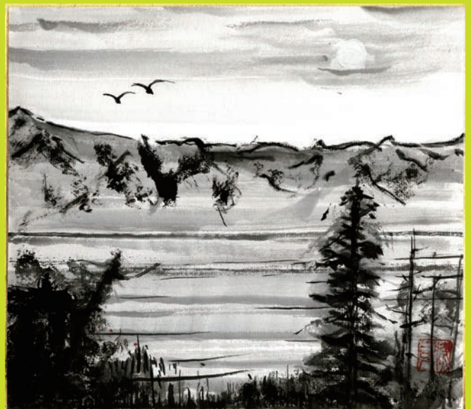
水墨画「静寂」 岡川 勝司 (欠町)