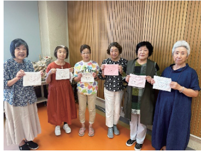
台ふき作成ボランティア