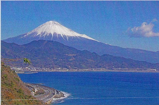
「 さった 薩埴岬から望む富士山」 古橋康弘 (若松町)