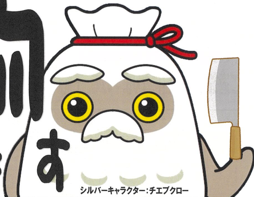
シルバーキャラクター：チエブクロ