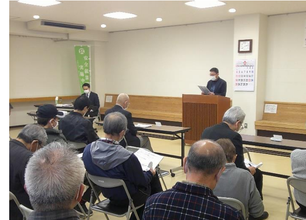
安全就業推進委員長による安全宣言