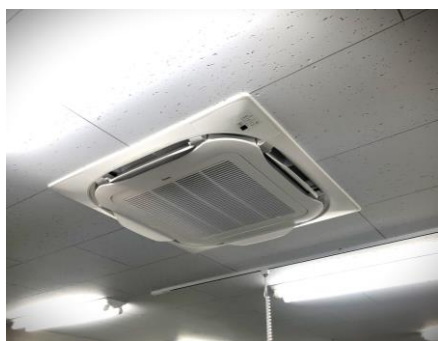
厨房へエアコンの導入(2基)

プールでひと泳ぎして、お腹を空かせた後のラーメン・天ぷらうどん・フライドポテトや唐揚げ等は、きつと利用されるお客様に喜んでもらえるはずですよ。お食事だけでもご利用できますので、会員の皆様も家族・友人・地域の方など、お誘い合わせのうえ、たくさんのご来店をお待ちしております。