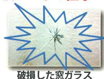
破損した窓ガラス

作業種別では除草・草刈り作業が最も多く、草刈機で石を跳ね住宅の窓ガラスを破損したものが3件、除草作業中に側溝に転落して入院した事例等がありました。慣れた現場であっても気を抜かず、周囲への注意を怠らぬようにお願いします。