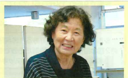
選挙事務 迎 ヨシノ