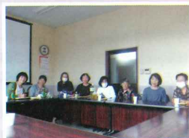
女性議員との懇談会