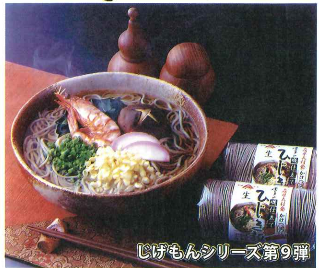
じげもんシリーズ第9弾