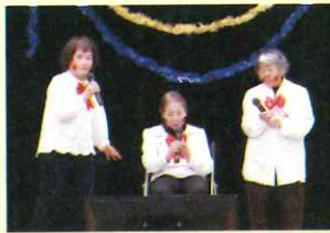
童謡をハモる 少女合唱団