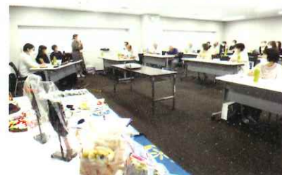
「長与時津シルバーセンター(さくら咲楽)」との交流集会