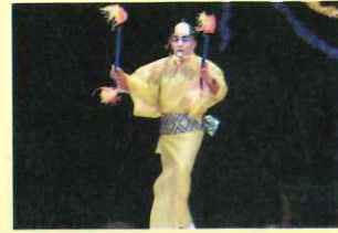
会場を沸かせた マツケンサンバ