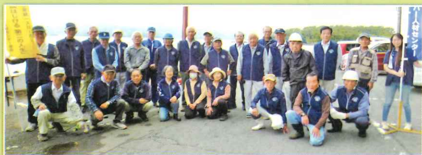
大村公園のボランティア大清掃に参加の皆さん