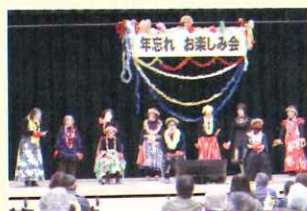
楽しく踊る スマイルの会の皆さん

最後に「いつでも夢を」をみんなで歌いました。帰り出口にて弁当が配られ12時過ぎには、帰路につくことができました。これからも会員皆様方の数多くの出演参加をお待ちしております。