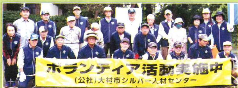
森園公園のボランティア大清掃に参加の皆さん