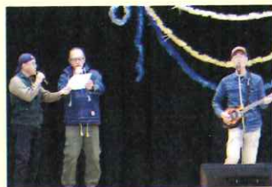
ギター弾き語りで 盛り上げ