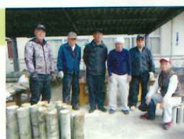
寒い中、門松作りに動んでいます

松・ナンテンなどの天然素材の収集が困難になり、一般の販売は取りやめています。門松づくりのノウハウは伝承し、皆さんで力を合わせていいものを作っていこうと考えています。