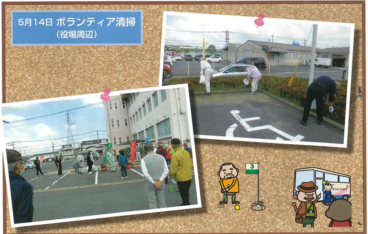
5月14日 ボランティア清掃 (役場周辺)