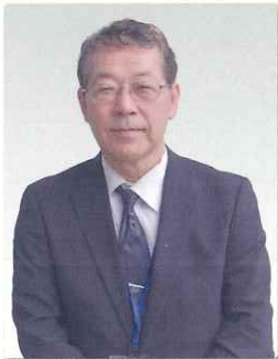
新常務理事 事務局長

今年で63歳になりますが、体力・知力に衰えを感じ、「年だから仕方ないなあ」とあきらめていたところ、会員の皆様の大変お元気な様子を見て「まだまだ頑張らな」と考える今日この頃です。できるだけ早く仕事に慣れ、少しでもお役に立てるよう頑張りたいと思いますのでよろしく願ひいたします。