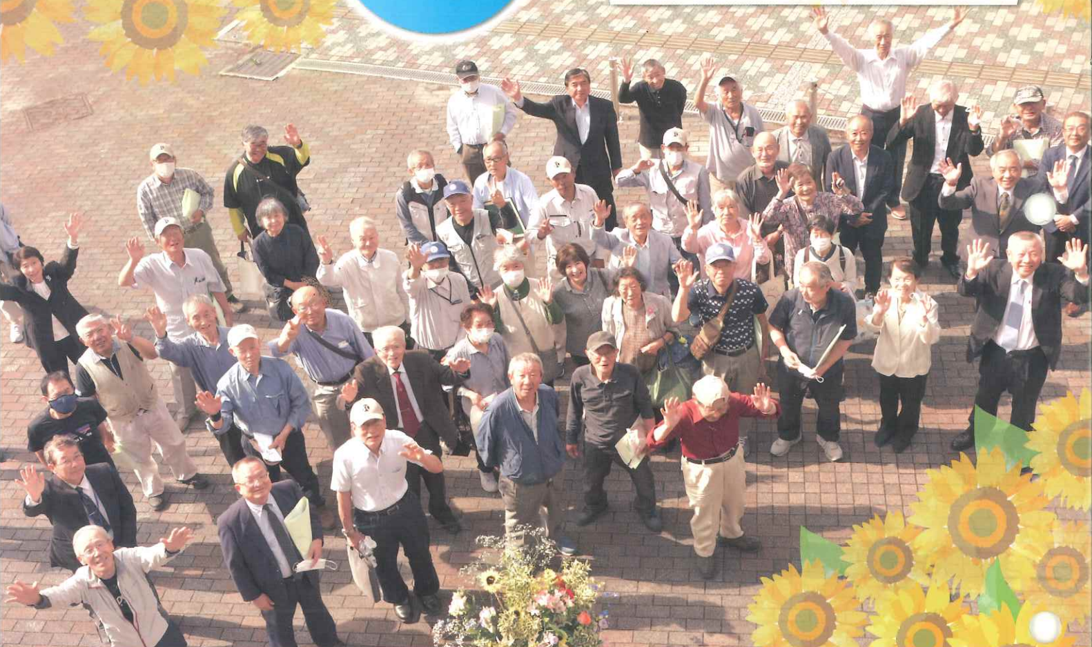
総会のあと、伝統産業会館前にて

https://webc.sjc.ne.jp/onosc/ 小野市王子町801番地(シルバーワークプラザ内) TEL.(0794)62-6222 FAX.(0794)63-5087