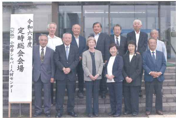
令和6年度 定時総会会場 (公社 小野市シルバー人材センター)