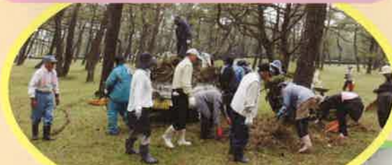
シルバーの日：ボランティア作業