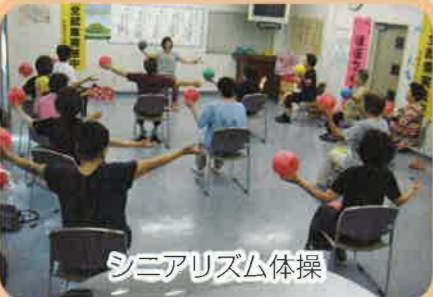
シニアリズム体操