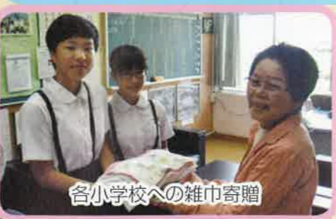
各小学校への雑巾寄贈