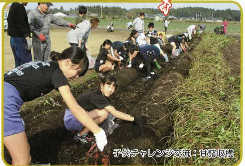
子供チャレンジ交流：甘藷収穫