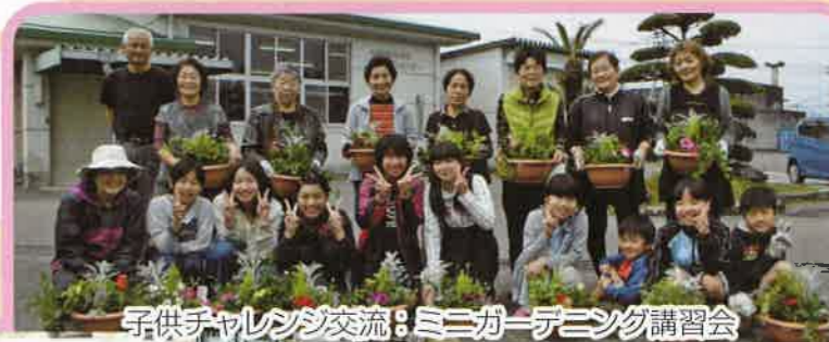
子供チャレンジ交流：ミニガーデニング講習会