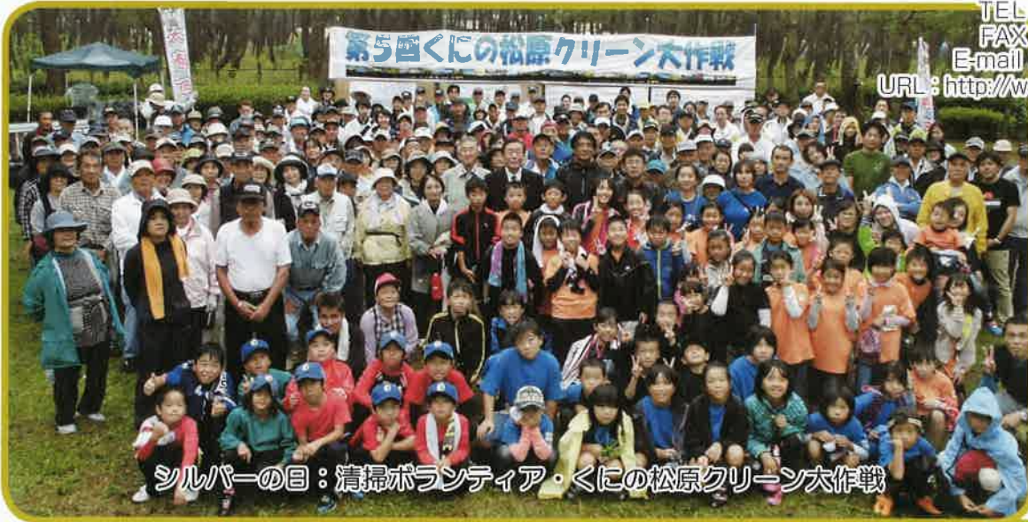
シルバーの目：清掃ボランティア・くじの松原クリーン大作戦

編集・発行 公益社団法人 大崎町シルバー人材センター 鹿児島県曾於郡大崎町仮宿 1870 番地 TEL 099-476-0202 FAX 099-476-0699 E-mail: oosaki@sjc.ne.jp URL: http://www.sjc.ne.jp/oosaki/