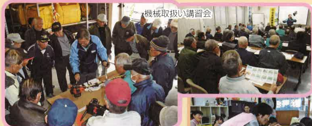
機械取り扱い講習会