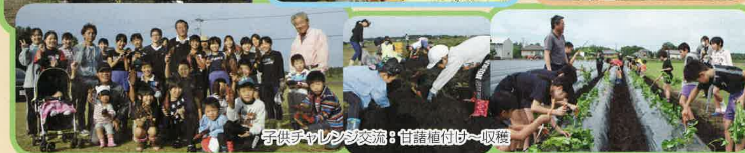
子供チャレンジ交流：甘藷植付け～収穫