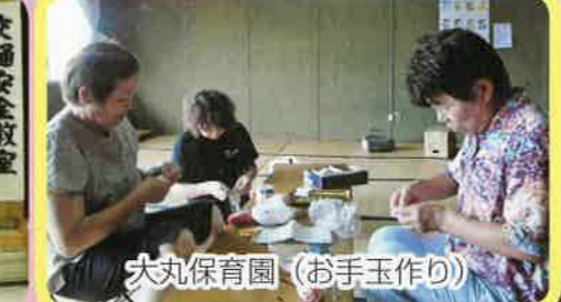
大丸保育園 (お手玉作り)