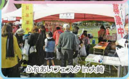
ふれあいフェスタ in 大崎