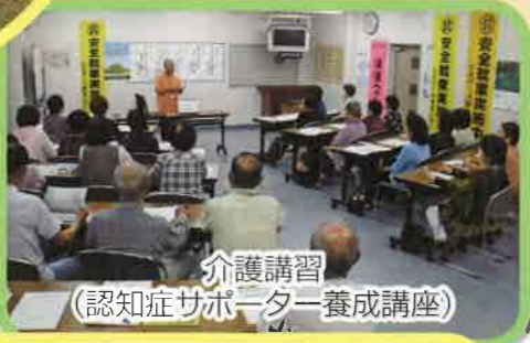
介護講習 (認知症サポーター養成講座)