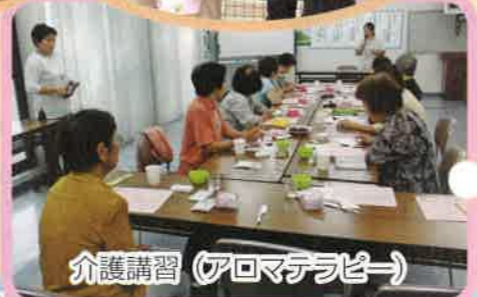
介護講習 (アロマセラピー)