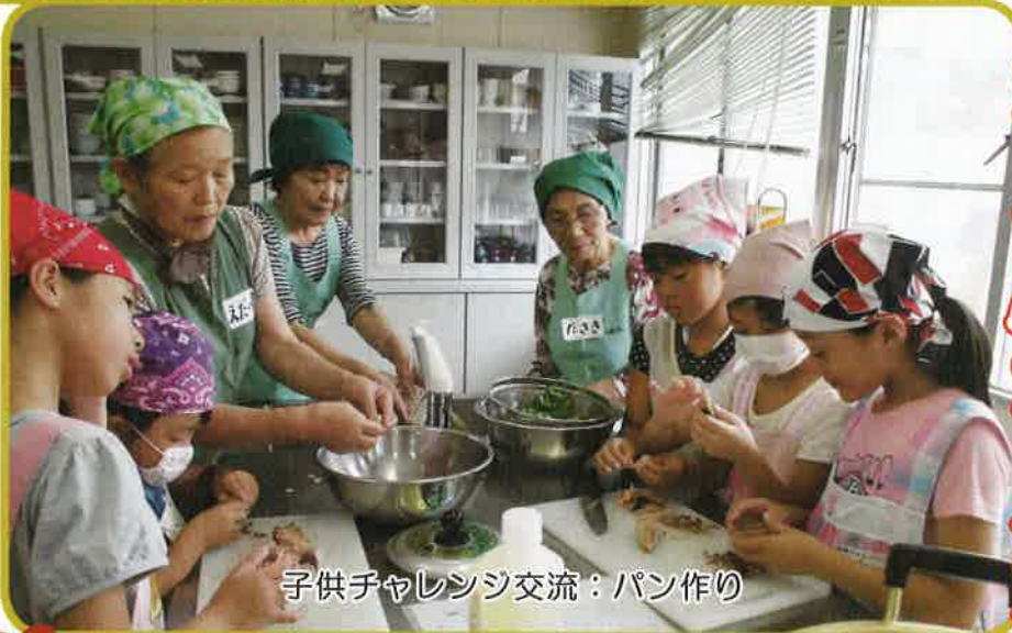
子供チャレンジ交流：パン作り