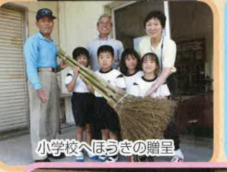
小学校へほうきの贈呈