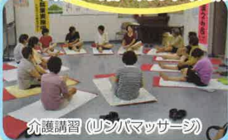
介護講習 (リンパマッサージ)