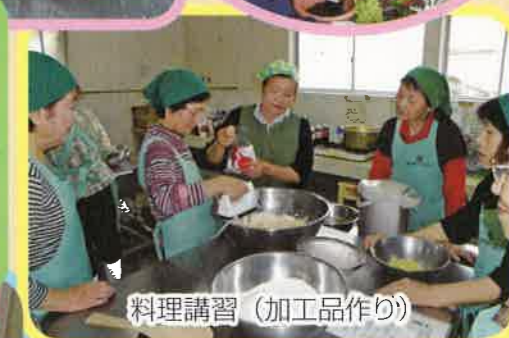
料理講習 (加工品作り)