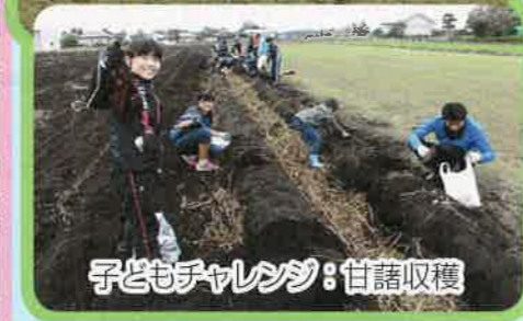
子どもチャレンジ：甘藷収穫