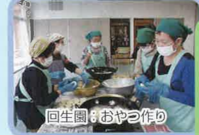
回生園：おやつ作り