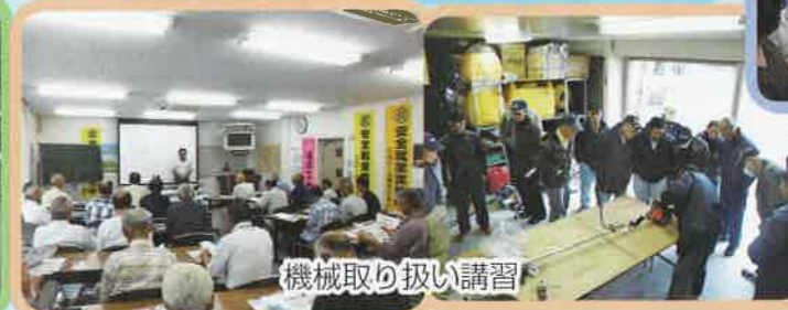
機械取り扱い講習