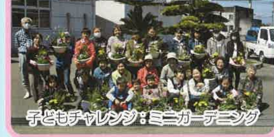
子どもチャレンジ：ミニガーデニング