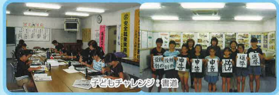
子どもチャレンジ：書道