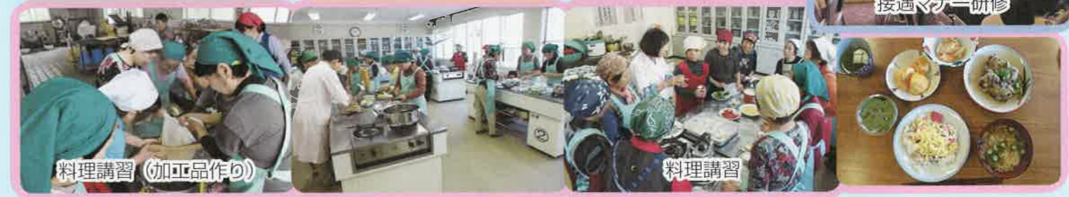
料理講習 (加工品作り)