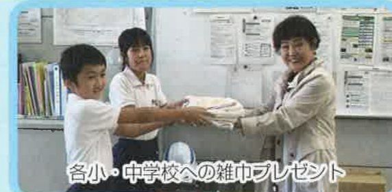
各小・中学校への雑巾プレゼント