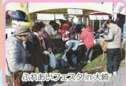
ふれあいフェスタ in 大崎