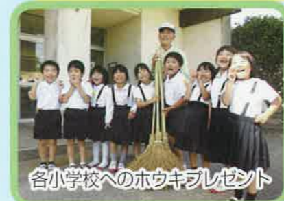
各小学校へのホウキプレゼント