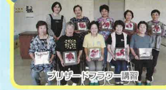
ブリーダーフラワー講習