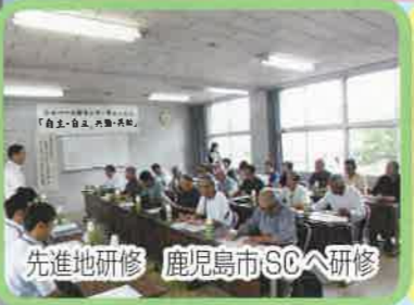
先進地研修 鹿児島市SCへ研修