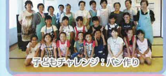
子どもチャレンジ：パン作り