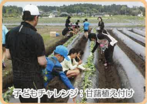
子どもチャレンジ：甘藷植え付け