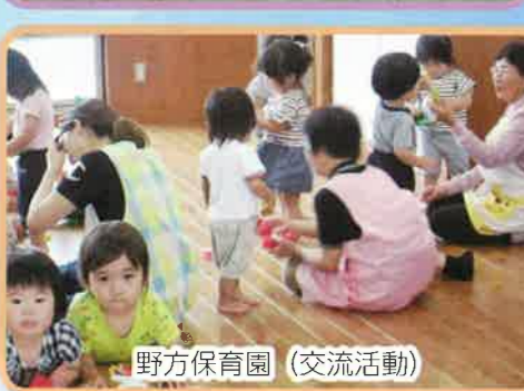
野方保育園（交流活動）