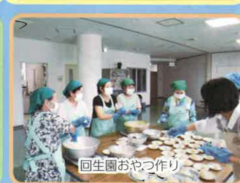
回生園おやつ作り