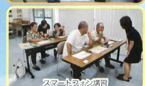
スマートフォンの講習