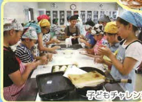
子どもチャレンジ：パン作り・交流