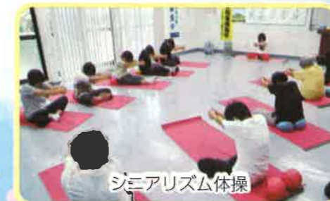
シニアリズム体操