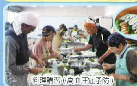
料理講習（高血圧症予防）