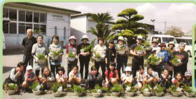
子どもチャレンジ：ミニガーデニング交流