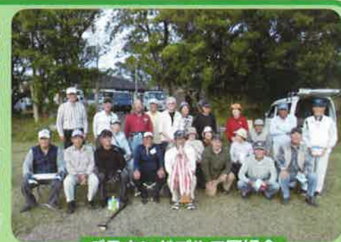
グラウンドゴルフ同好会