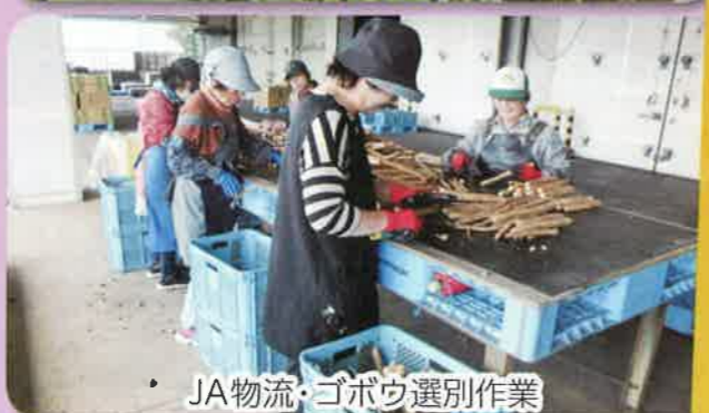
JA物流・ゴボウ選別作業