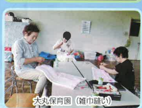
大丸保育園（雑巾縫い）