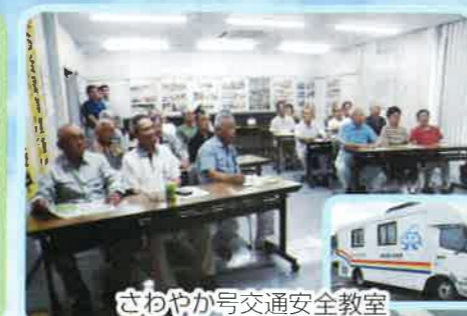
さわやか号交通安全教室