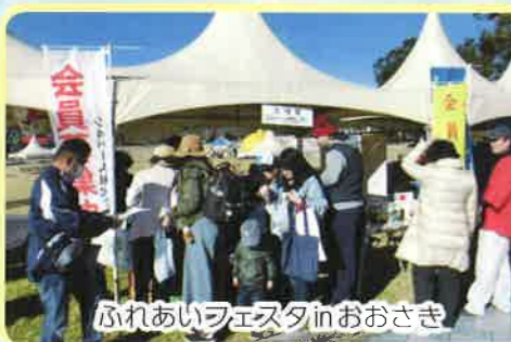
ふれあいフェスタinおおさき