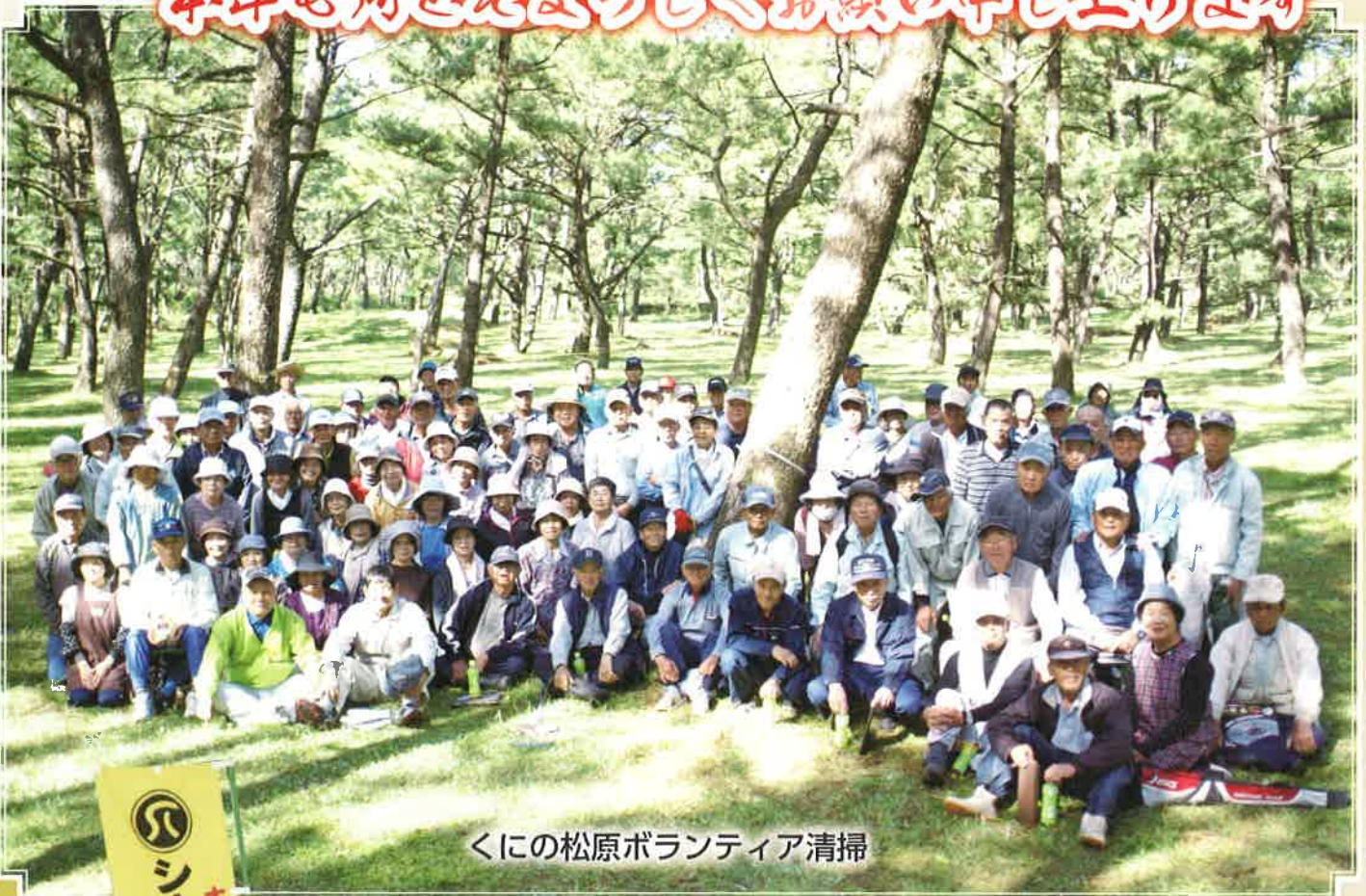
くいの松原ボランティア清掃