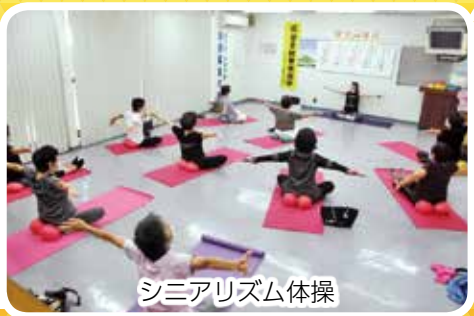
シニアリズム体操