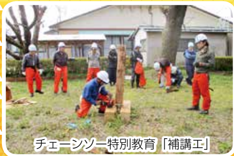
チェーンソー特別教育「補講Ⅰ」