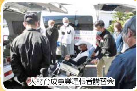
人材育成事業運転者講習会