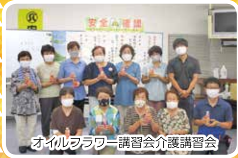
オイルフラワー講習会介護講習会