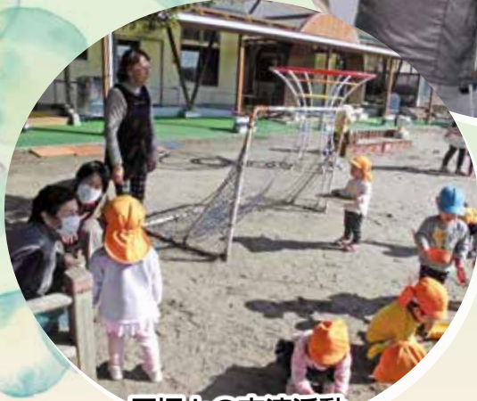
園児との交流活動