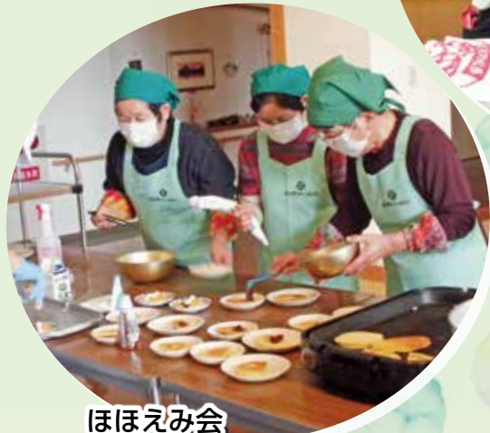
ほほえみ会 ホットケーキづくり