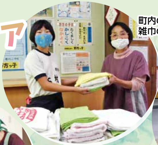
町内の小・中学校の 雑巾の贈呈