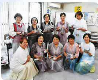
アロマテラピー講習