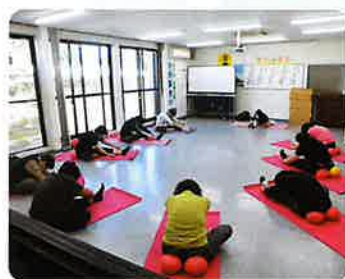
シニアリズム体操