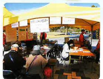
ふれあいフェスタ出店