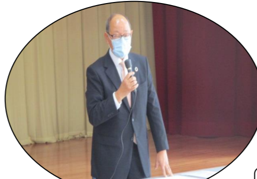
介護認知症予防断捨離講習