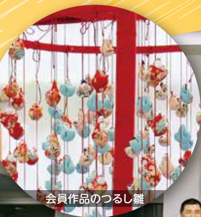
会員作品のつるし雛